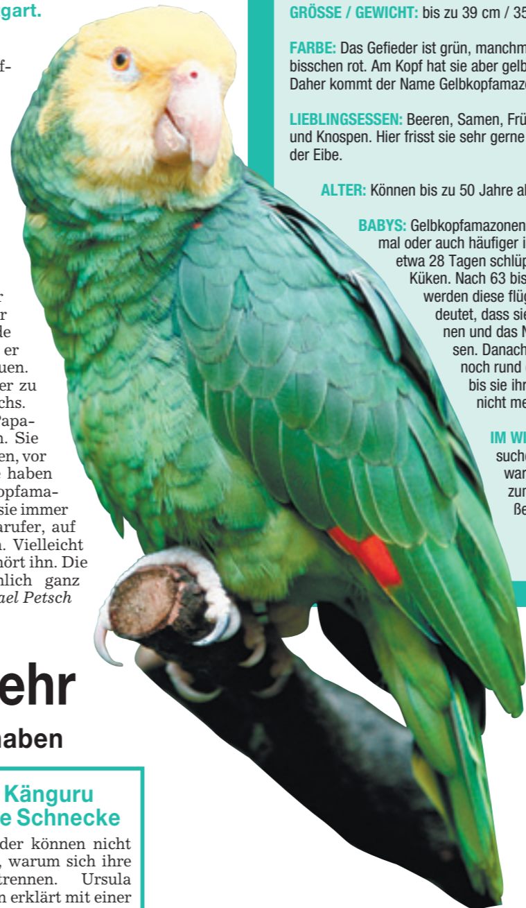
Geht doch mal durch den Schlossgarten: Vielleicht seht ihr so eine Gelbkopfamazone. Gestaltung: acweber

IM WINTER ... suchen sie sich warme Plätze, zum Beispiel außen an Kaminen