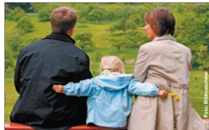
Links Papa, rechts Mama: Das haben manche Kinder nicht