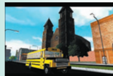
Mit dem Bus durch die Stadt

Wolltet ihr nicht auch schon immer mal einen Bus fahren? Das könnt ihr nun am PC üben. Denn in dem Spiel „Bus Driver“ geht es darum, möglichst viele Fahrgäste einzusammeln und an den nächsten Stationen wieder abzuliefern. Dafür gibt es Punkte. Allerdings ist es nicht so einfach, wie es sich anhört, denn ihr müsst euch an die Verkehrsregeln halten. Wer andere Autos anrennelt oder vergisst, den Blinker zu setzen, bekommt Punkte abgezogen.