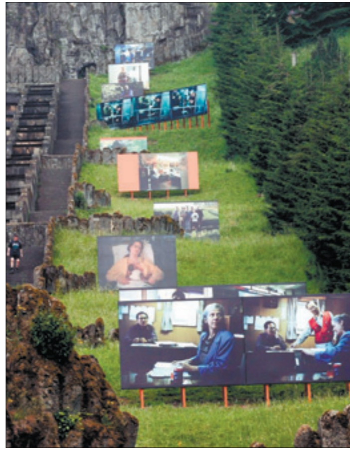
Kunst in der Natur: Die Bilder von Allan Sekula