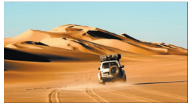
Ein Auto fährt durch die Libysche Wüste in Afrika

Doch man kann etwas gegen Verwüstung tun. Oft hilft es ein wenig, Bäume zu pflanzen. Ihr Schatten schützt zum Beispiel den Boden vor der Sonne. dpa