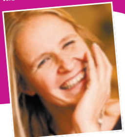
Lösung: Cornelia Funke