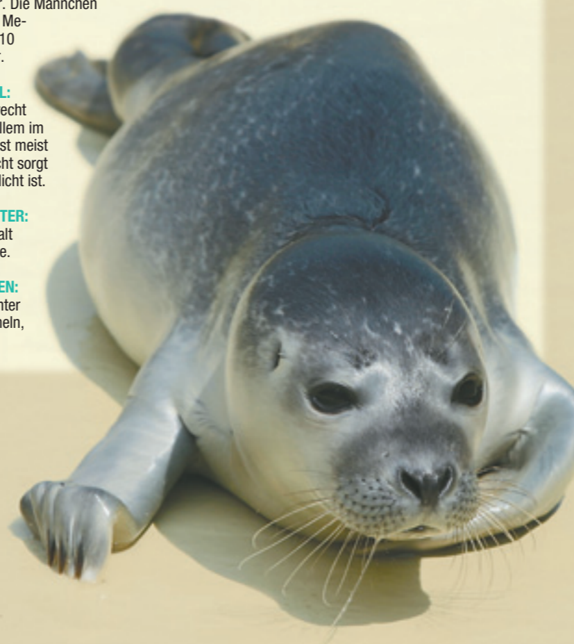
Gestaltung: alexander

BESONDERHEIT: Meist bleiben erwachsene Seehunde nur fünf bis zehn Minuten unter Wasser. Sie können aber bis zu 40 Minuten lang und 200 Meter tief tauchen. Ihre Rufe klingen wie ein heiseres Bellen.