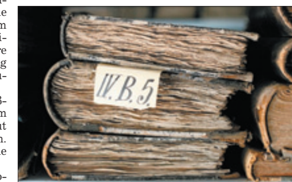
In einem Archiv lagern alte Schriftstücke dpa

Menschen, die in Archiven arbeiten, laden dazu viele Leute ein, mal bei ihnen vorbeizuschauen. dpa